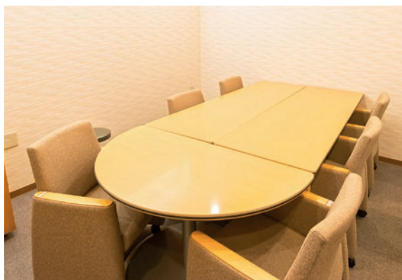
応接談話室 Reception / Lounge Room