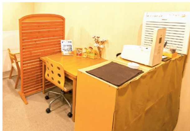
待合室 Waiting Room