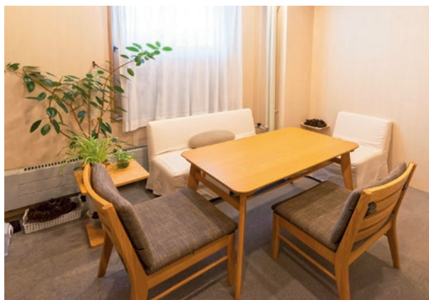
面接室 Counseling Room

学生相談室は、みなさんとの出会いの中で、一人ひとりのチカラや術を一緒に見つけていける場でありたいと思っています。些細なことでも構いません。学生相談室でお話してみませんか。